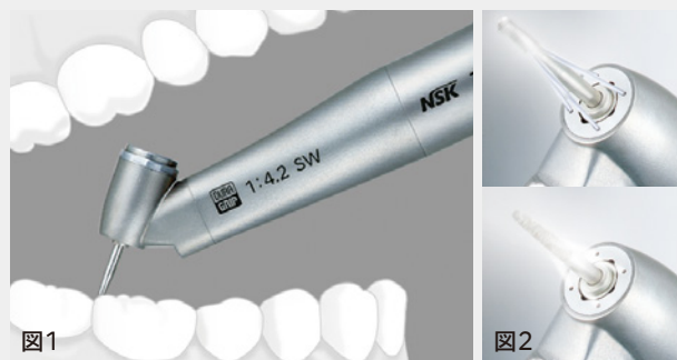
図1: ヘッド部45度の形状から大白歯遠心部等到的に確にバーをアクセスさせることができる。