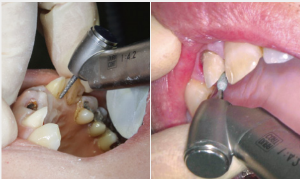
図5：上顎前歯部口蓋側の形成時に、ヘッド部45度の形状から、口蓋側軸面やリンガルコーン部に的確にバーを当てることが可能。