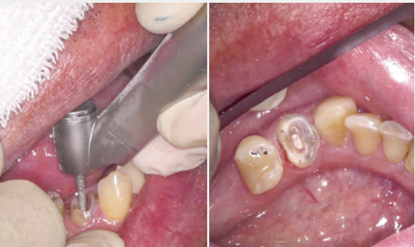
図6：下顎小白歯での根管内の切削。根の形態に合わせて、バーを平行にストレスなく当てられるため、的確な根管内の形成を行うことが可能。