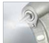
シングルスプレー