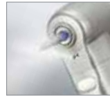
シングルスプレー