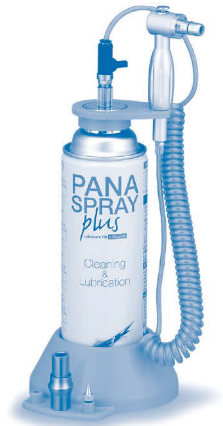
※パナスプレープラスは付属していません。