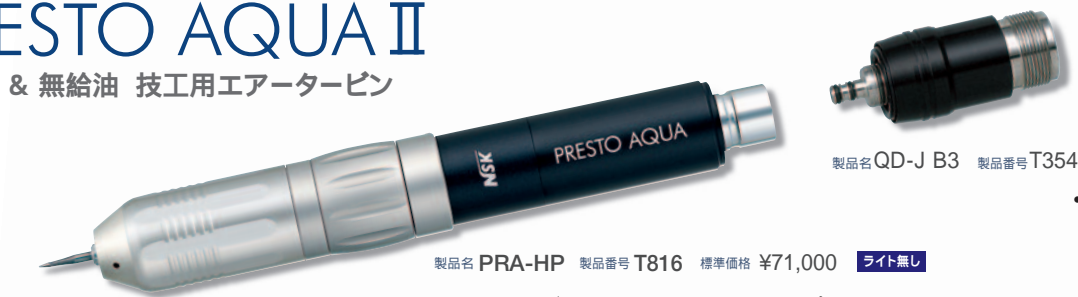
製品名 QD-J B3 製品番号 T354051 標準価格 ¥9,500