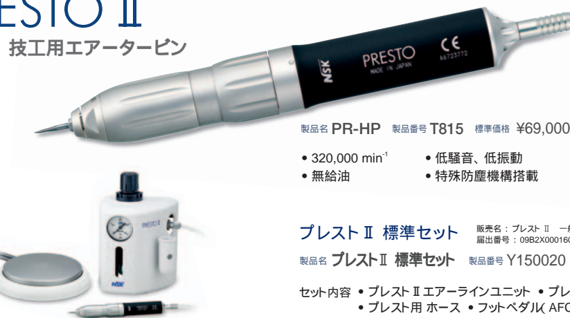
製品名 PR-II 製品番号 T815 標準価格 ¥69,000 ライト無し