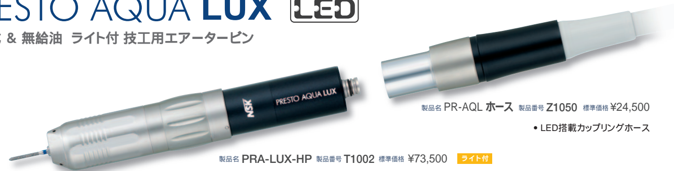
製品名 PR-AQL ホース 製品番号 Z1050 標準価格 ¥24,500