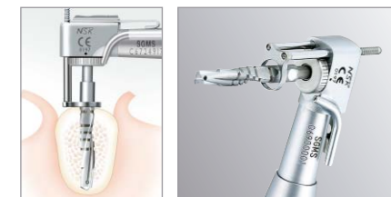
着脱が簡単な調整幅8mmと12mmの 2種類のストッパー付。

販売名: サージカルハンドピース SGMS-ER 一般的名称: 手術用ドリルアタッチメント 届出番号: 09B2X00016000018号 一般医療機器