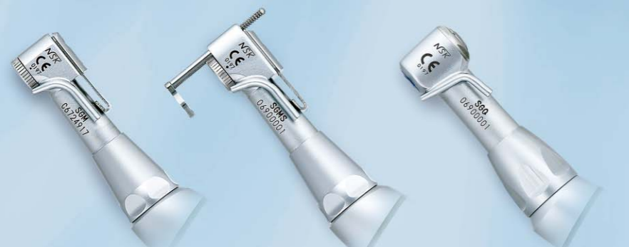
SGM-ER20i ラッチ式 超ミニヘッド

口腔外科(インプラント)手術に要求される精度と安全性、操作性を追求して開発された超ミニサイズのヘッドにより、口腔内の視野の確保がよりスムーズになります。