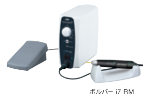
ボルバー i7 RM