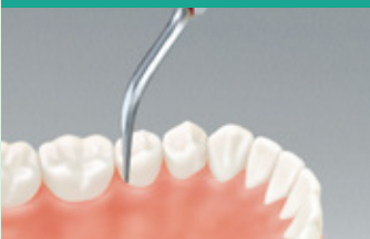
スケーリングチップ