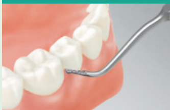
う蝕除去用チップ